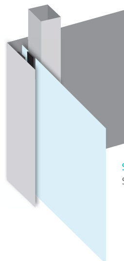
Sistema paredes OPTIMA Sistema paretS OPTIMA